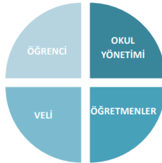
Şekil 1: Okul Temel Paydaşları

Paydaş analizi süreci gerçekleştirildikten sonra beyin fırtınası uygulaması ve memnuniyet anketi sonuçları değerlendirilerek elde edilen görüş ve öneriler ile belirlenen sorun alanları, kurum içi ve çevre analizleri, GZFT analizi ve geleceğe yönelim bölümünün hedef ve tedbirlerine yansıtılmıştır.